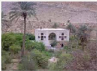
قلعه یا عمارت شیرینه