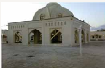
آرامگاه سلطان پیر هاشم