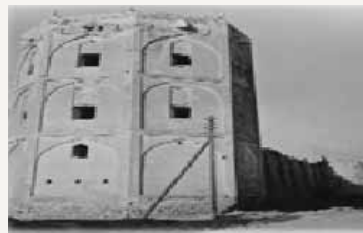
قلعه محمدخان دشتی