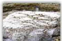
اشکال گل کلمی