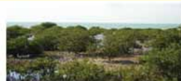
گرامینه و درختچه‌های گز