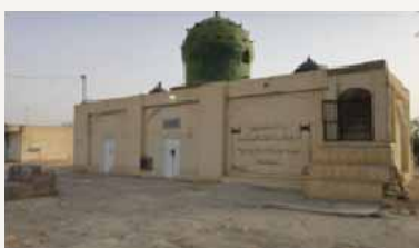
آرامگاه پیر ارم یا چهل گز