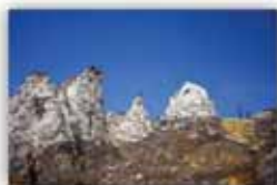
سطوح رنگارنگ گنبد

شهرستان دشتی به مرکزیت شهر خورموج، دومین شهرستان وسیع استان به‌شمار می‌رود. در سال‌های اخیر این شهرستان به‌دلیل توجه نسبی به جاذبه‌های گردشگری آن، به یکی از جایگاه‌های ویژه گردشگری در سطح استان تبدیل شده است، لذا با معرفی، سامان‌دهی و بهره‌برداری از توان‌های اکوتوریستی آن، می‌تواند در آینده یکی از قطب‌های مطرح گردشگری کشور در جوار خلیج فارس باشد