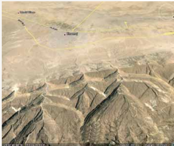
شکل ۲: کوه‌های شهرستان دشتی