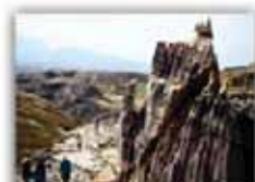
تخت دیو یا دودکش جن